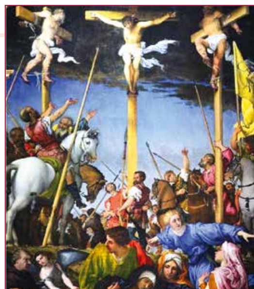
Crocifissione. Olio su tela di Lorenzo Lotto, datato al 1529-1534 e conservato nella chiesa di Santa Maria della Pietà in Telusiano a Monte San Giusto (Marche).

Lorenzo Lotto (sua la Crocifissione in copertina) è l’artista scelto per accompagnare anche il Tempo di Quaresima e di Pasqua. Nelle sue opere, individuiamo i Testimoni della Gioia.