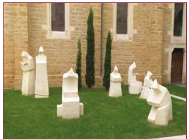
Un memoriale dei monaci di Tibhirine

E c'è un agire successivo: quello che offre riparo e riparazione, opera per ricucire le ferite, non solo quelle del corpo, ma anche gli strappi nel tessuto dei legami e delle relazioni che la violenza produce. La persona mite è una grande e paziente rammendatrice. Sa che la terra che gli è promessa in eredità è, per ora, una terra continuamente da aggiustare e di cui prendersi cura.